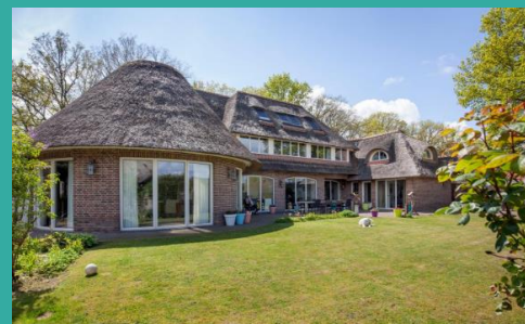
Zorghuis de Huiskamer