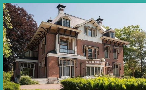
Zorghuis Huize Scherpenzeel